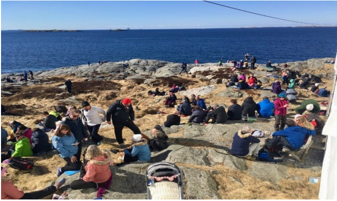
Utfartsområde for små og store frå Sveio, Haugalandet og Sunnhordland.