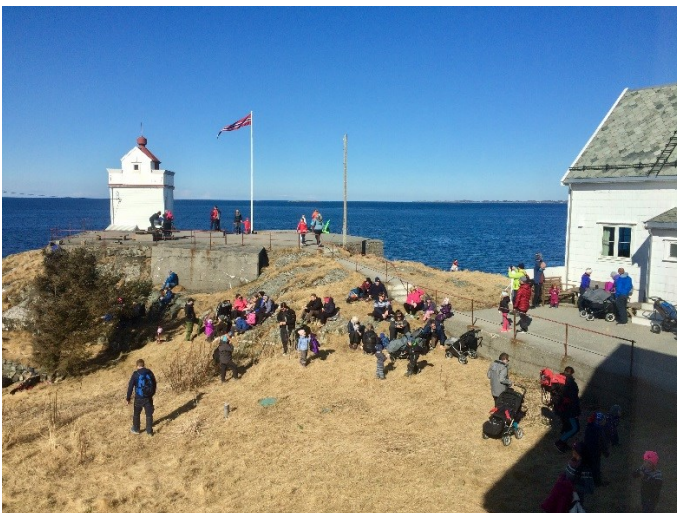
Solskinnsdag på Ryvarden fyr.