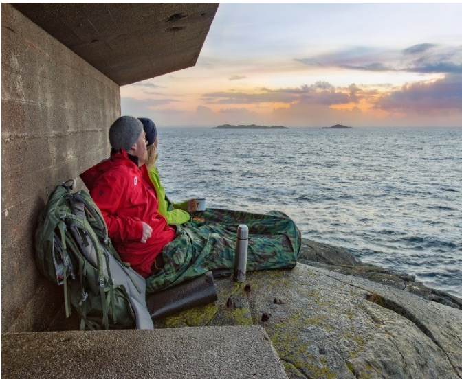
Ein stille stund ved storhavet.