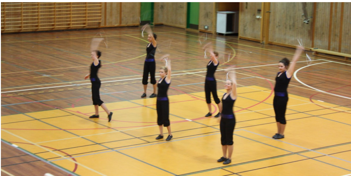
Idrettshallen på Vigdartun står sjeldan ubrukt. Sveio drilltropp er ein av dei faste brukarane.

Fleire kommenterer at det bør bli gjeve meir støtte til drift/vedlikehald av lokale.