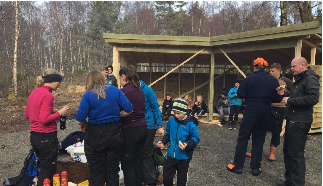
Frivillige organisasjonar bidrar til å gjera bygdene våre til gode stader å bu. Sisu 4H har samarbeidd med andre lag i Valestrand om å laga ein naturmøteplass i nærmiljøet.

Sveio kommune hadde 5.709 innbyggjarar ved utgangen av tredje kvartal 2018. Det vil seia at kommunen hadde ein promille av folketalet i Noreg. Om vi legg Statistisk Sentralbyrå sitt tal på 125 milliardar i årleg verdiskaping i frivillig sektor i Noreg til grunn, er det realistisk å rekna med at frivillig sektor i Sveio genererer ei verdiskaping på minst 125 millionar kroner årleg. Dette er med på å streka under kor viktig frivillig sektor er for utviklinga av lokalsamfunnet Sveio.