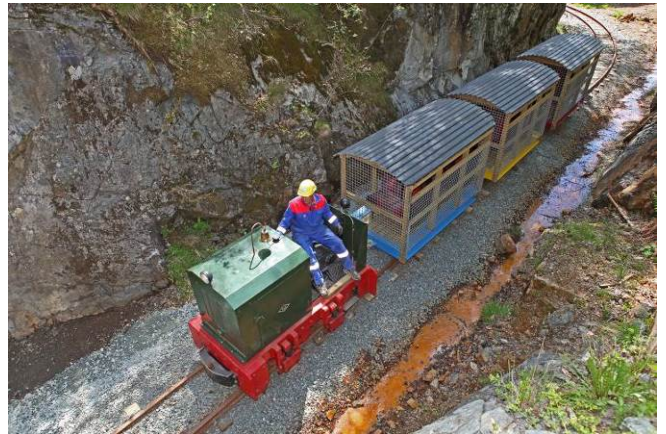
Frå Gruvene på Litlabø

Heishuset er rydda og nymala med nytt varmeanlegg, og vert mykje nytta til festlege samkomer av ulike slag. I huset finn me det første kraftaggregatet frå Børtveit kraftstasjon og ei unik samling av fotografi frå gruvemiljøet. Det flotte og ruvande heistårnet er sikra innvendes, og har trapper like til topps. Arbeidet med å sikra tårnet utvendes er kome godt i gang. Venelaget for Gruo ser fram til å opna tårnet for publikum. I parken ved Arbeidarbustaden har Venelaget fått reist eit flott monument i bronse av "gruvearbeidaren", og i det gamle «Kontoret» er det laga aktivitetshus der Stord husflidslag og ulike kunstnarar held til.