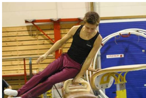
Frå turnhallen på Vikahaugane

Mellom turnhallen og den nyaste fleirbruks-hallen ligg det 5 sprintbanar for 60 m. Opna i 1995. Rehabiliterert 2014.