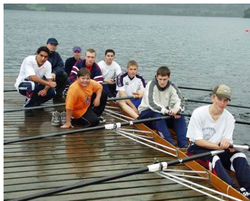
Kvinnherad Rosenter

Kvinnherad rosenter vart etablert i 1991 og held til i Opsangervatnet, Husnes. Anlegget vert drifta av Kvinnherad roklubb og er etablert i tråd med Roforbundet sine retningslinjer og ønsker. Anlegget består av 500 meter bane, 2000 meter bane og rohuse. Rohuset inneheld møterom, samlingslokale, kjøkken, lager, treningsstudio og garderobar. Det er 2 brygger som gir tilgang til vatnet og følgebåt med motor.