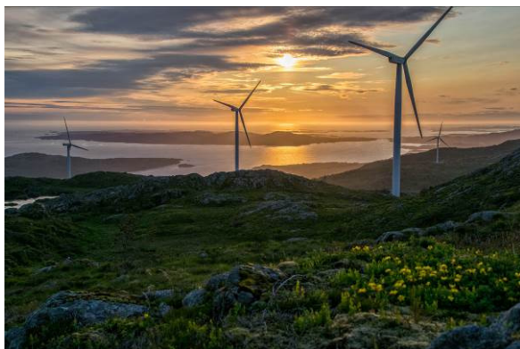
Frå Vindmølleparken i Fitjar

Ser me til folkehelselova vil det vera viktig å nå ut til folk med stor breidde i høve tilbod om fysisk aktivitet. Det må difor vera ei utfordring for regionen og kvar einskild kommune å utvikla regionale anlegg som gjev ei betre breidde i tilbodet totalt sett.