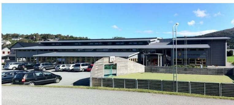
Fitjar kultur og idrettsbygg

Fitjar kultur og idrettsbygg har avtale med Norsk bygdekino. Kinoen har godt besøk og er 6. mest besøkte bygdekinoen i landet.