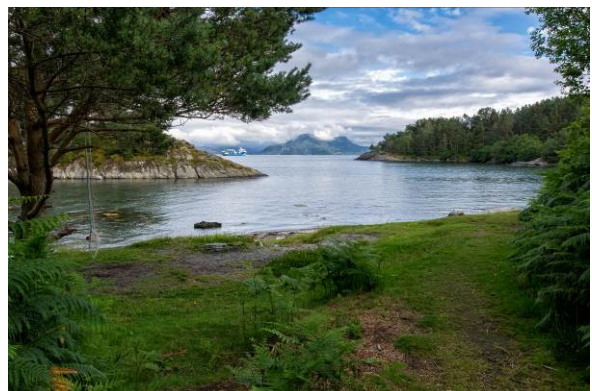
Hystadmarkjo, Stord