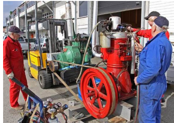
Stord Maritime museum