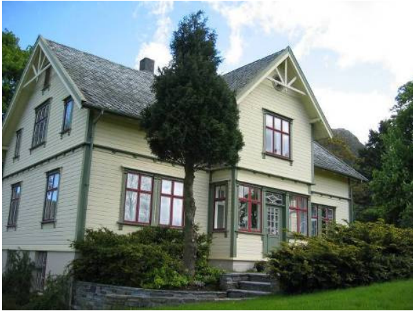
Fartein Valen heimen

Heimen til komponisten Fartein Valen er ein av fem komponistheimar i Hordaland og sentral i arbeidet med formidling av Fartein Valen sitt livsverk. Bygget er i privat eige og formidlingsarbeidet blir drive av Fartein Valen-stiftelsen. Valen var prega av landskapet han vaks opp med og ei rekkje element i landskapet blir knytt til formidlinga av musikken og livet hans.