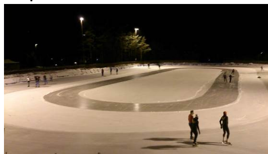
Skeisebanen på Stord

Banen vart offisielt opna i 2001 og er med sine 5000 m 2 den største kunstfrosne isflata på Vestlandet. Rundløpsbana er på 250 m og er den fyrste i sitt slag i Noreg. Banen har flomlys, høgtalar/musikkanlegg, varmestove med toalett, garderobar, dusj, kiosk og eit stort fellesrom. Normal opningstid for banen er oktober-mars. Det er planar om å byggja hall over banen. Søknad om ny teknisk godkjenning er sendt i mars 2016.