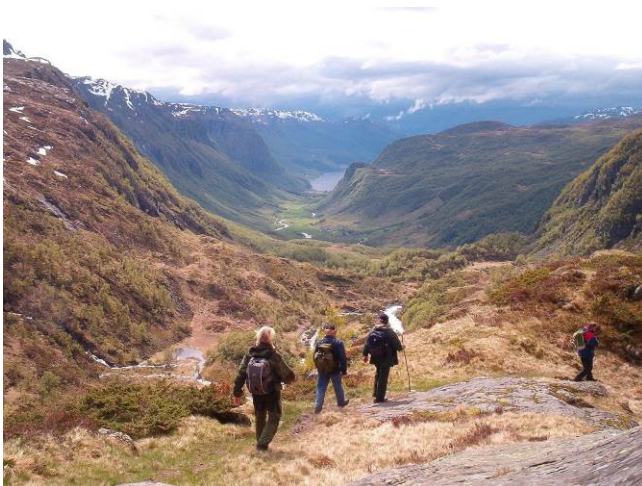
Stordalen frå Bjødnanut

Etnefjella strekker seg om lag 5 mil frå Ølen i vest til Seljestad i aust. Der går T-merka løyper gjennom heile området og har seks turisthytter i regi av Haugesund Turistforening. Frå Etnesida er der rundt ti oppgangspunkt til fjellet, spreitt jamt ut frå Etne i vest, via Stordalen og austover langs E-134 i Åkrafjorden.