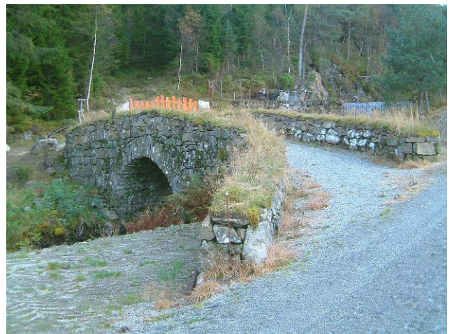
Postvegen Skånepik

Det er ei målsetting at Postvegen gjennom Etne og Kvinnherad skal være ein samanhengande kulturhistorisk turveg.